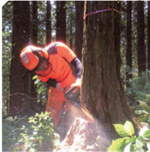
チェーンソーによる伐倒作業