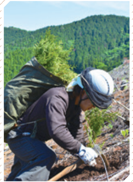
スギ・ヒノキ植林作業