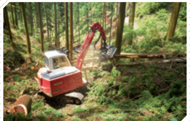
プロセッサによる造材作業

当森林組合では、組合員の皆さまの森林を中心に集約化を進め、高性能林業機械やICT等を活用し事業の効率化を図り、持続可能な林業経営をととして林業所得の向上を目指します。