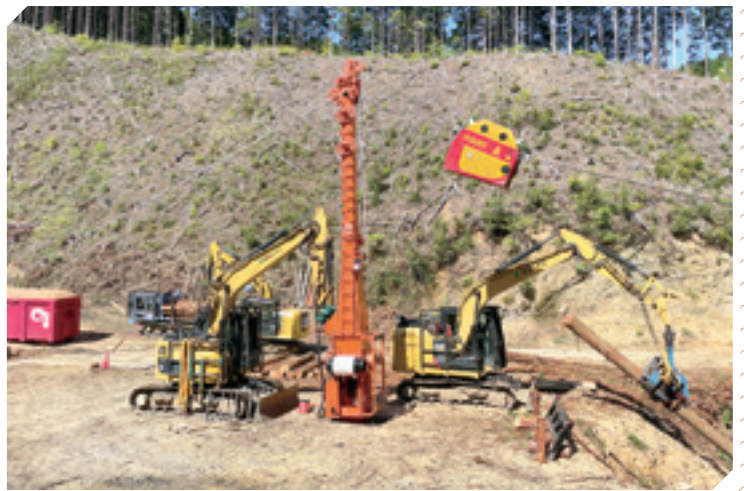
架線系作業システム